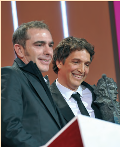
“Bucarest, la memoria perdida”