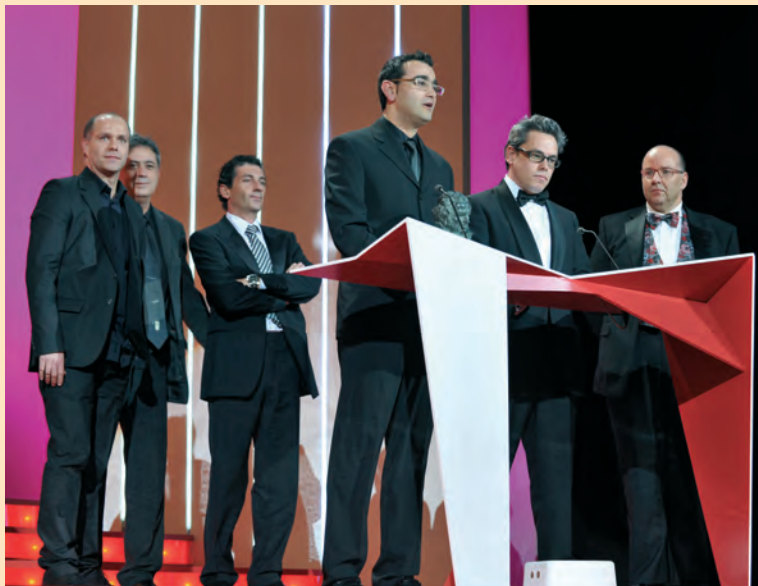
“El lince perdido”

Mejor película de animación: “El lince perdido”, de Manuel Sicilia y Raúl García. (Kandor Graphics, S.L. – Green Moon España, S.L. – Perro Verde Films, S.L.)