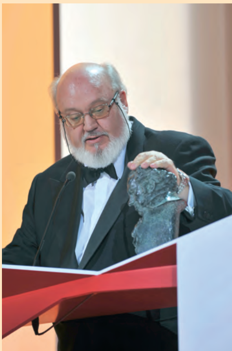
José Luis Cuerda