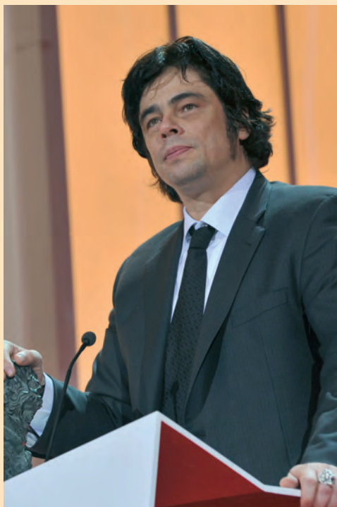
Benicio del Toro