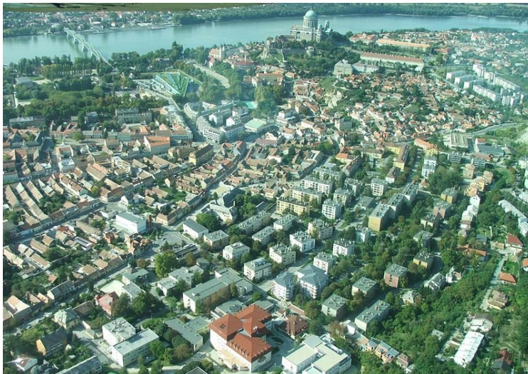
Fotografía 1 Vista aérea