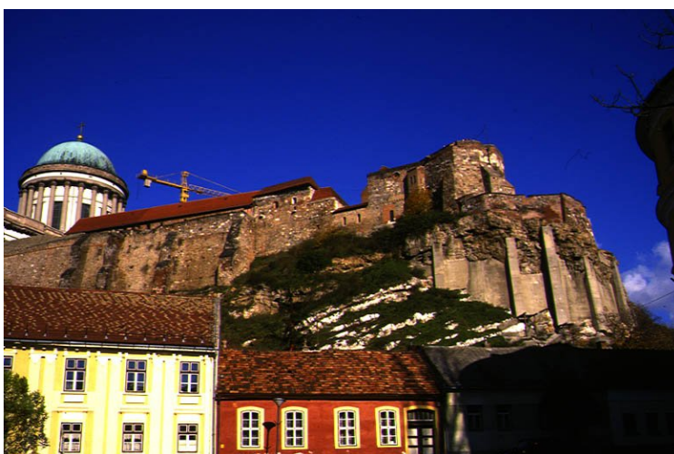
Fotografía 2 Vista del Promontorio del Castillo (antes de la reconstrucción – recubrimiento – de la Torre Blanca)