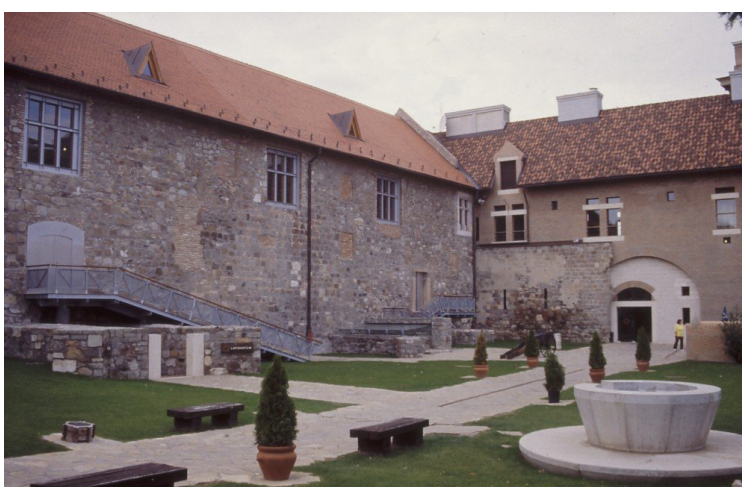
Fotografía 3 Patio interior con detalles de la fachada del llamado pequeño Palacio Romano