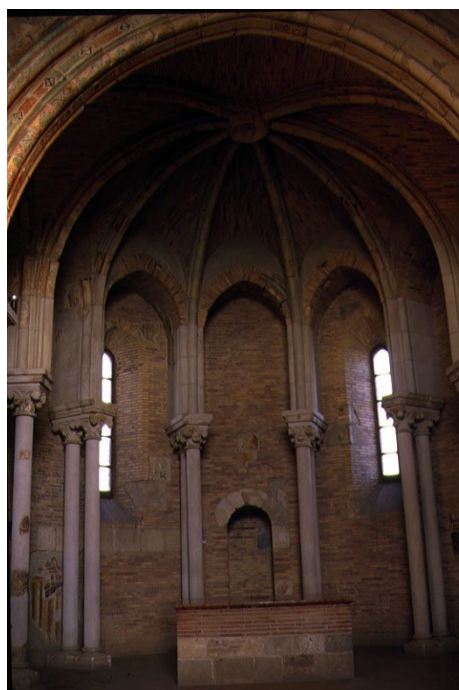
Fotografía 5 Vista interior de la Capilla del Castillo