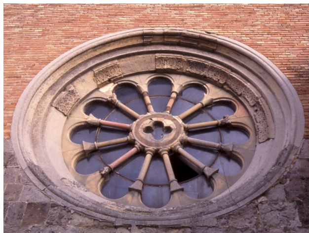
Fotografía 4 El rosetón de la Capilla del Castillo