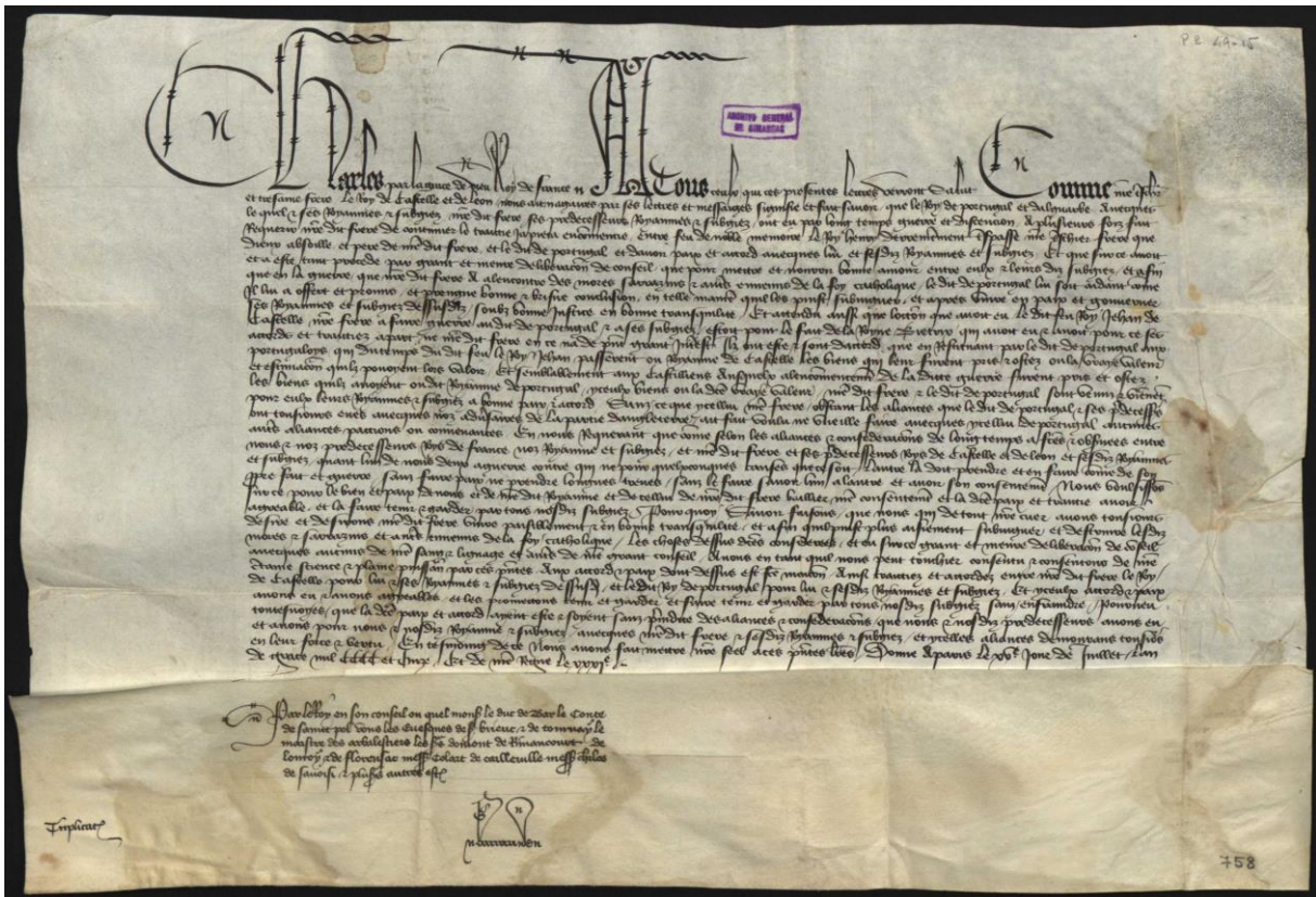
Unidad documental nº 5