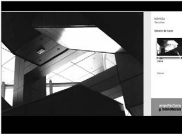
Detalle ampliada procedente de la galería de imágenes

Pretendemos que los usuarios puedan realizar búsquedas selectivas a través de las diferentes salas de un conjunto de bibliotecas: salas infantiles, hemerotecas y que puedan ver diferentes aspectos de su interés: mobiliario, materiales (acero, cristal, madera), iluminación (exterior e interior, natural o artificial).