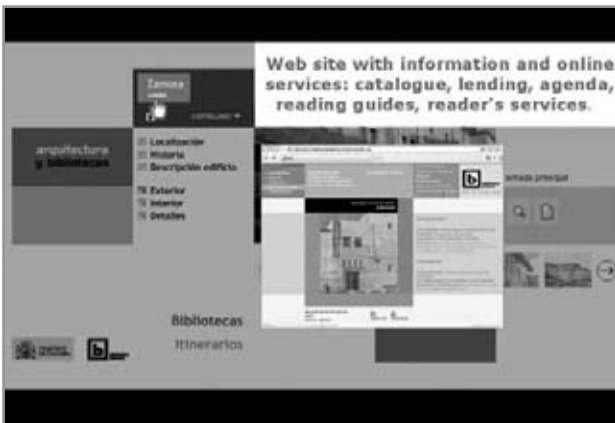
Detalle de sección de la Biblioteca Pública del Estado en Zamora

Pero pasemos a explicar ahora los dos puntos de acceso principal. El usuario selecciona por cuál de ellos desea comenzar -Bibliotecas o Itinerarios-, y mediante un sencillo menú alfabético, selecciona la opción que desea visitar.