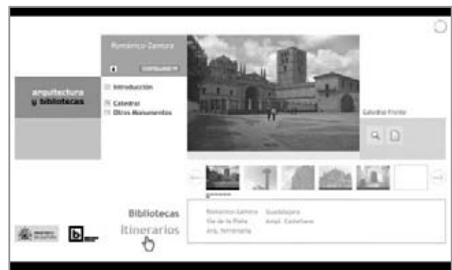
Detalle del itinerario asociado a la Biblioteca Pública del Estado en Zamora

El acceso al recorrido por un itinerario también se selecciona mediante el mismo menú alfabético como en el caso anterior, la galería de imágenes del itine-