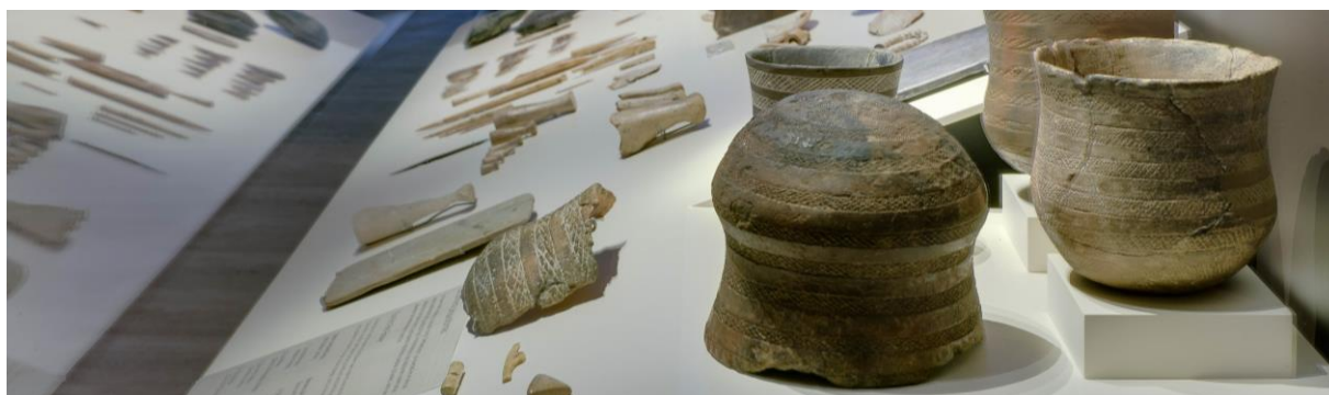
Museo Arqueológico Nacional.