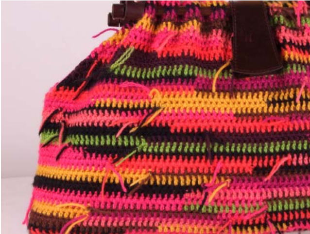
Bolso Sacatepequez: Montaña de hierba Julia Alonso Calabuig, España