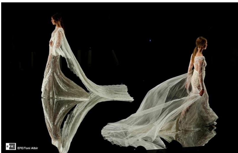
Desfile de novias de Yolancris, en la Barcelona Bridal Week I Barcelona, 2015 I Fotografía digital.