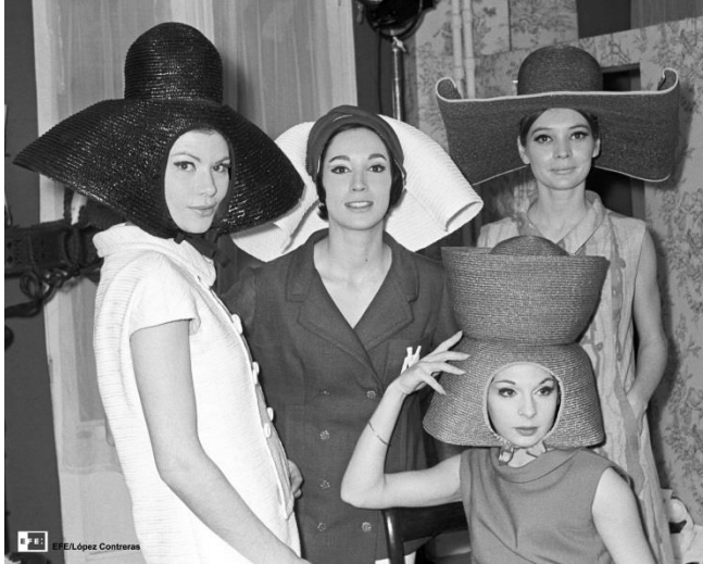
Modelos durante un desfile de la firma Vargas Ochagavía | Madrid, 1965