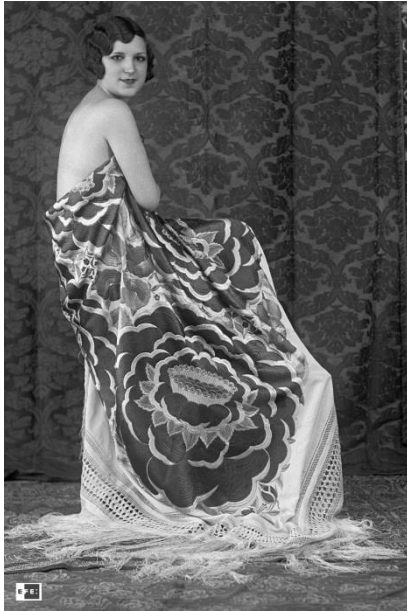
Retrato de mujer con un mantón de Manila | Madrid, 1932 | EFE | Placa de vidrio.