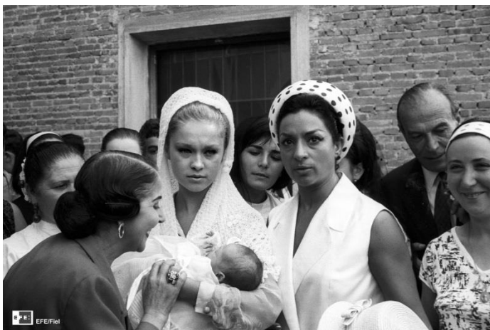
La cantante Marisol, junto a Lola Flores (dcha) y Estrellita Castro (izq) en el bautizo del hijo de Carmen Sevilla y Augusto Algueró | Madrid, 1964