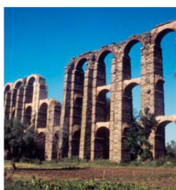
Acueducto romano de Los Milagros (Mérida). 1976