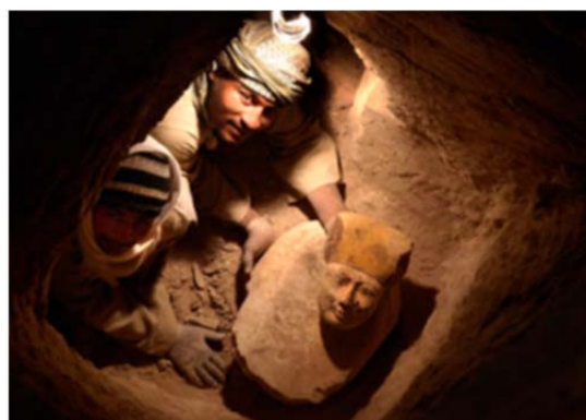
Tumba de Hery, Djehuty (Luxor, Egipto). 2012

EXCAVANDO EN EGIPTO , plasma la presencia de los arqueólogos españoles en Egipto se remonta a la colaboración de nuestro país en la campaña de la UNESCO, iniciada en 1960, para salvaguardar los restos arqueológicos egipcios y nubios que iban a ser destruidos con la creación de la presa de Asuán. Desde entonces, los esfuerzos de nuestros egiptólogos se han concentrado en varios yacimientos y, singularmente, en Herakleopolis Magna, en Ihnasya el-Medina, junto al lago Fayum, y más recientemente en la tumba de Djehuty, en la necrópolis de Tebas.