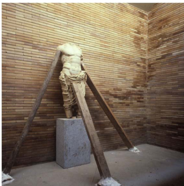
Proceso de montaje de una escultura romana en el Museo Nacional de Arte Romano de Mérida. 1986