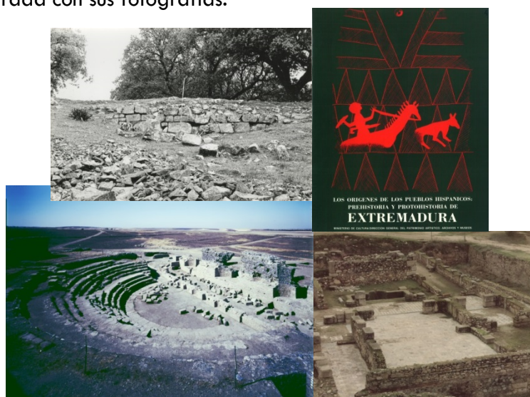
Fig. 1. Vista de la muralla de Nertobriga (Fregenal de la Sierra, Badajoz). Fig. 2. El teatro romano de Regina (Casas de Reina, Badajoz). Fig. 3. Portada del catálogo de la Exposición Prehistoria y Protohistoria de Extremadura . Fig. 4. La domus de la Alcazaba de Mérida.

Por ello, no es de extrañar que las muestras retrospectivas de las intervenciones realizadas por la Dirección General de Bellas Artes en los yacimientos de la Provincia de Badajoz (Bellas Artes-83), en coincidencia con otras a nivel nacional, fuera mayoritariamente ilustrada con sus fotografías.