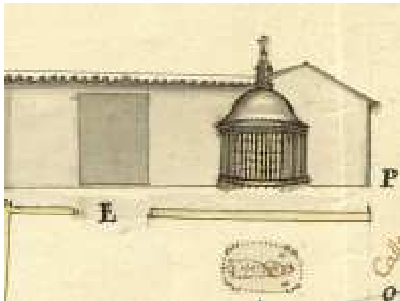
AHN, CONSEJOS,MPD. 2997

Archivo Histórico Nacional C/Serrano, 115 28006 MADRID http://www.mecd.es ahn@mecd.es