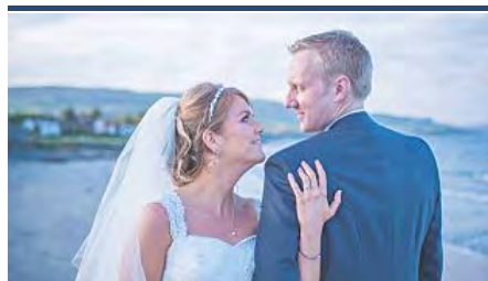
Muere una pareja de recién casados durante...