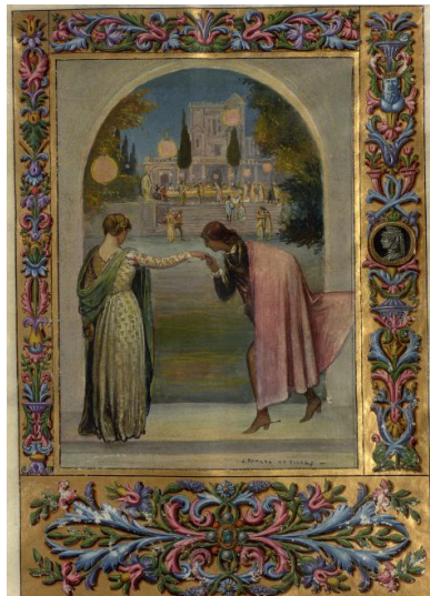
Ilustración de Julio Romero de Torres