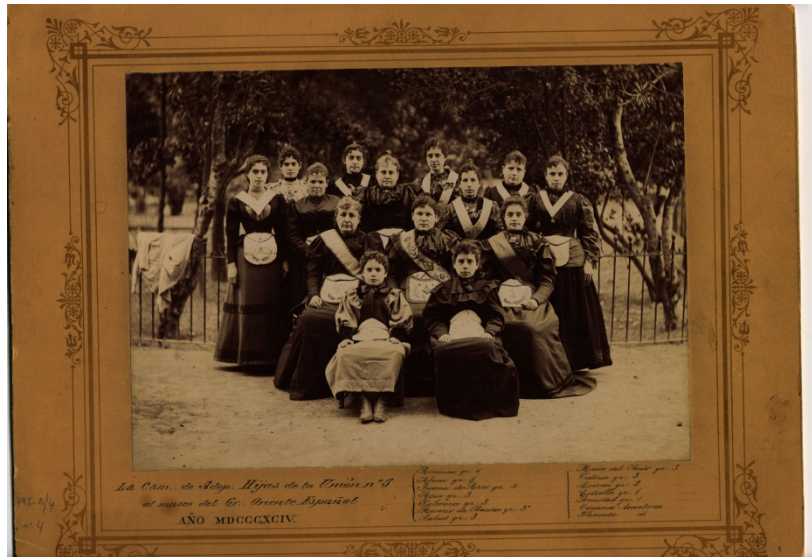
Masonas de una Logia de Valencia en el año 1894