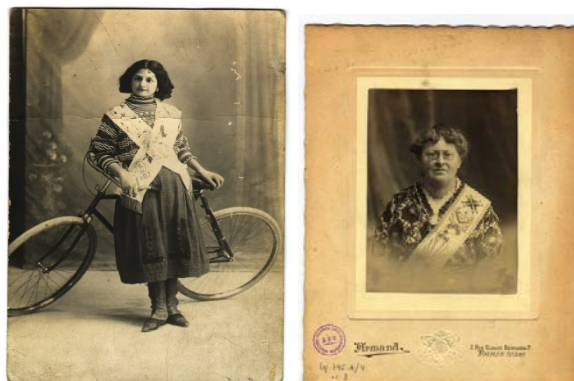
Retrato de una masona anónima en Alicante y de una masona francesa

A las 12,30 horas se realizará una visita guiada que versará sobre el fondo iconográfico masónico custodiado en el CDMH, con explicación del concepto, origen, finalidad, filosofía y simbología masónicas, expresadas a través de atuendos y objetos diversos.