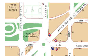
Seu C/ Almogàvers, 77

* La unitat responsable de la Carta de Serveis és la Direcció de l'Arxiu.