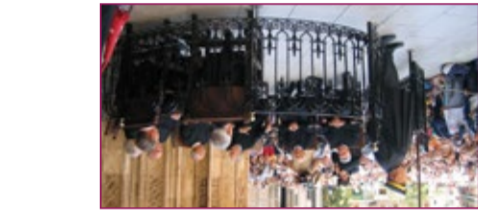
1 La Patum de Berga, 2008

Esta tradición, está íntimamente asociada a la identidad cultural del territorio vino del teatro hilgoso europeo medieval y la