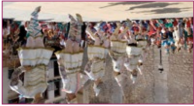
8 Fiesta de la Mare de Déu de Sant Lluís

La técnica de formación de los costiles se viene transmitiendo tradicionalmente de generación en generación dentro de grupos, se adquiere exclusivamente mediante la práctica.