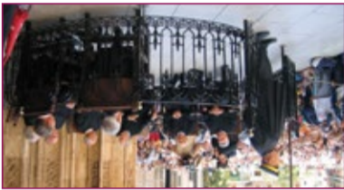
3 Triunfal de regantes del Mediterráneo de la Huerta de Murcia y el Tribunal de Regantes de Hombre Buenos

Esta tradición, está íntimamente asociada a la identidad cultural del territorio vino del teatro hilgoso europeo medieval y la