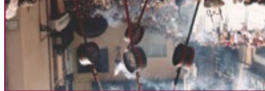
1 La Patum de Berga, 2008