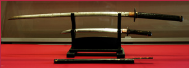
Espada larga, tipo "katana". Espada corta, tipo "wakizashi"