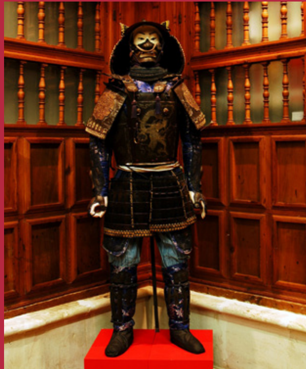
Armadura de samurái

C/ Miravete, 8 – 47130 Simancas (Valladolid) Tel.: 983 59 00 03 – 983 59 07 50 – 983 59 18 12 Fax: 983 59 03 11 Correo-e: ags@me.cd.es www.me.cd.es