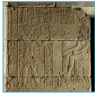
Capilla de Adijalamani Ofrenda de sistros a Isis