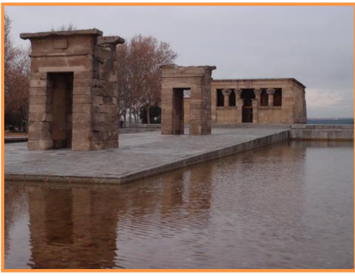
Vista del Templo de Debod