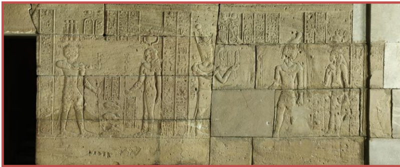
Vestíbulo. Ofrendas a Isis y a Isis y Osiris