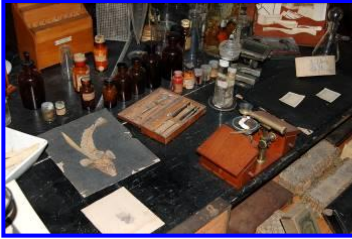
Recreación Estación Biología Marina de Santander.