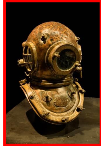
Escafandra de buzo.