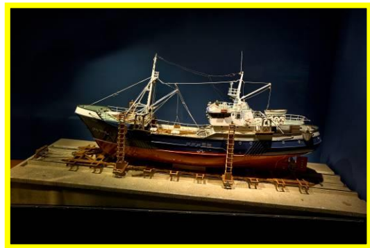
Modelo de buque arrastrero. Autor modelo: Manuel Losada Cabrero.