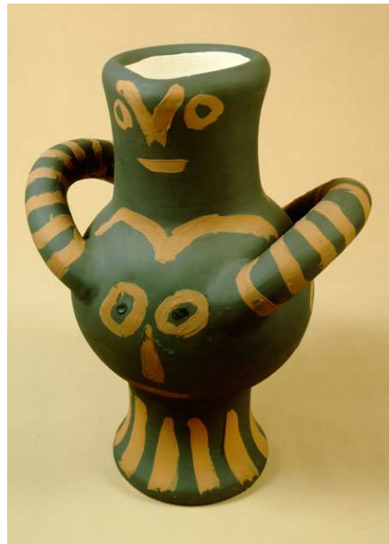
Ánfora Pablo Picasso, 1963