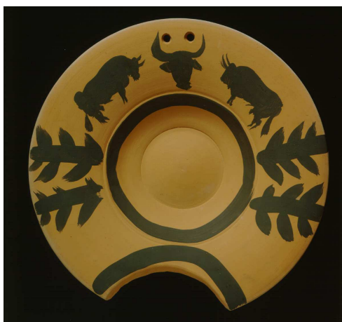
Anverso de bacía de barbero Pablo Picasso, 1959