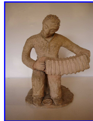
Escultura de barro