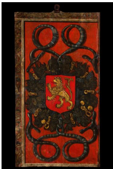
Blasón de Zaragoza (ca.1520) Martín García Puyazuelo (atribución) Temple y óleo sobre tabla