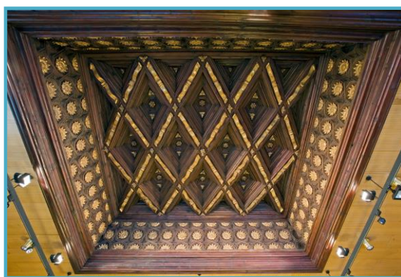
Techumbre mudéjar-renacentista (Ca.1510-1515) Procedente del Palacio de los Marqueses de Osera Anónimo

Acceso al catálogo colectivo de la Red Digital de Colecciones de Museos de España: http://ceres.mcu.es