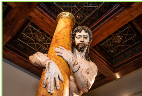
Cristo abrazado a la columna (ca.1600) Anónimo Talla sobre madera de pino