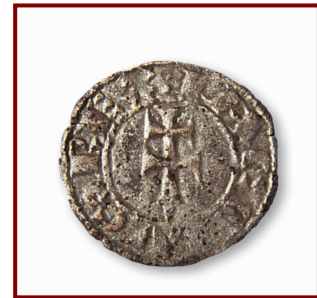
Moneda de Jaime I, 1234 -1272