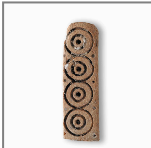
Placa de Hueso, siglos XI - XII.