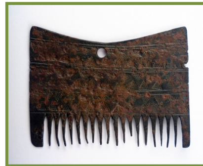
Peine de bronce de época prerromana

Acceso al catálogo colectivo de la Red Digital de Colecciones de Museos de España: http://ceres.mcu.es