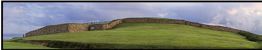
Muralla de módulos prerromana del sistema defensivo del castro de la Campa Torres