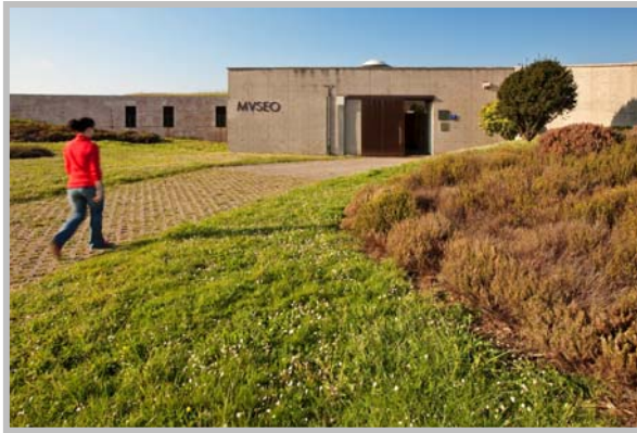
Parque Arqueológico- Natural de la Campa Torres. Exterior del edificio del Museo