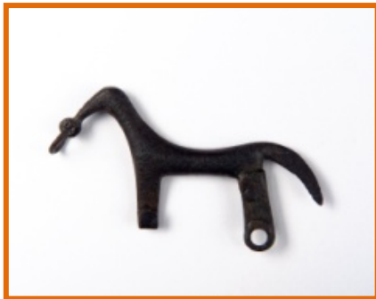
Fíbula zoomorfa de época prerromana que representa un caballo