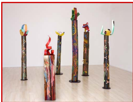
Bosque Totémico. Francisco García Torcel (1991)