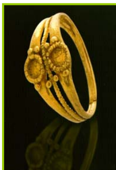
Anillo. (S. I d. C.)