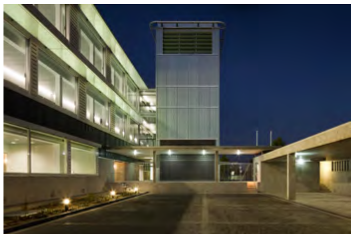
Dos vistas exteriores del nuevo Centro de Conservación y Restauración de Filmoteca Española

Suscripción a la alerta del programa mensual del cine Doré en: