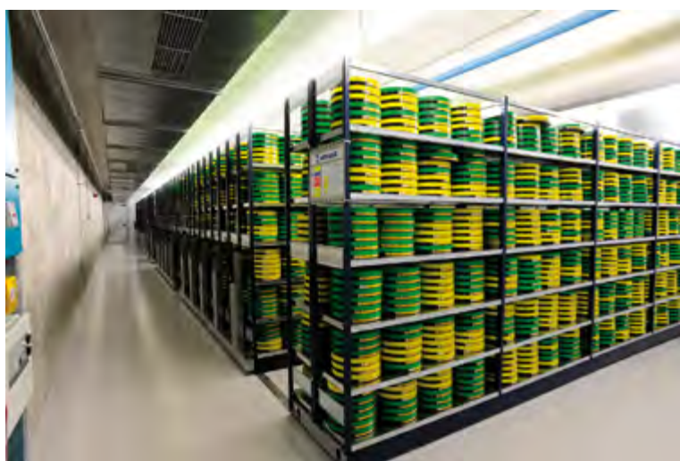
Vista de uno de los almacenes del Centro de Conservación y Restauración de Filmoteca Española