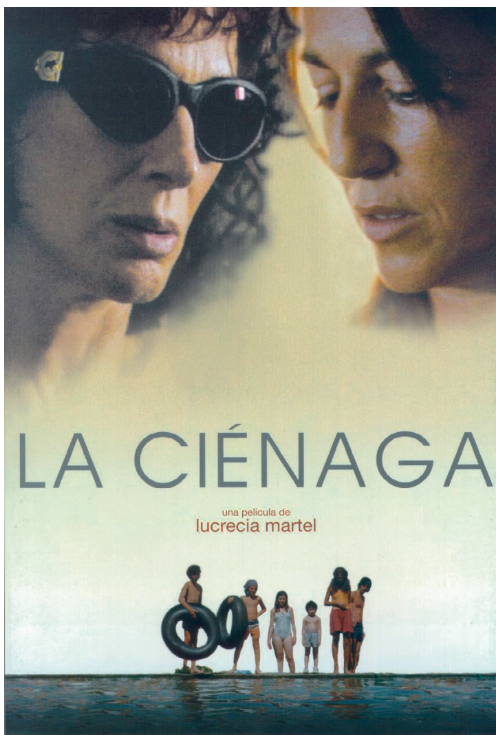
La ciénaga (Lucrecia Martel, 2000).

Suscripción a la alerta del programa mensual del cine Doré en: