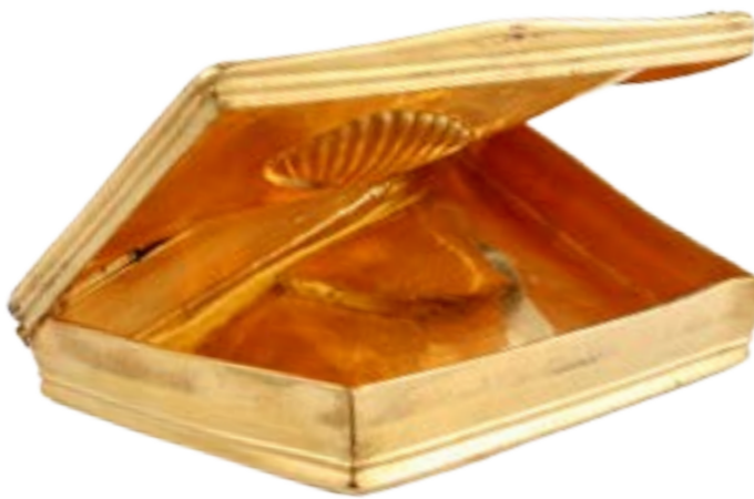
Cajita de oro para rapé Hacia 1700-1725 Pecio de la fragata Mercedes Museo Nacional de Arqueología Subacuática (ARQUA), Cartagena, Murcia

El ataque inglés fue el detonante para que la Corona española declarase la guerra a Gran Bretaña. Los acontecimientos, entonces, se precipitaron. La firme alianza de España con Francia dejó abierto el camino hacia Trafalgar y, tras el desastre, los nuevos planes de Napoleón conducirían a la ocupación de Portugal y de España. El hundimiento de la Mercedes y el apresamiento de las otras tres fragatas representan un hito entre dos épocas y simboliza el inicio de una etapa de trascendentales consecuencias para nuestra Historia