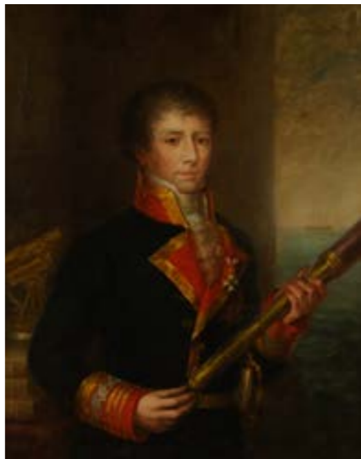
Diego de Alvear y Ponce de León Copia de Candelaria de Alvear Óleo sobre lienzo. 103 x 81 cm Museo Naval. Madrid

Por su parte, Diego de Alvear había sido nombrado en 1783 comisario de la expedición encargada de fijar los límites entre los territorios españoles y portugueses en América del Sur. Durante casi veinte años exploró las cuencas de los ríos Paraná y Uruguay, hasta que en 1801, al estallar de nuevo la guerra con Portugal, se dio por finalizada la misión y se trasladó a Buenos Aires. A principios de agosto de 1804, Alvear se encontraba en Montevideo para regresar a España con su familia a bordo de la Mercedes pero, en el último momento, tuvo que sustituir a Tomás de Ugarte, segundo jefe de escuadra que, gravemente enfermo, no pudo viajar. Alvear transbordó a la Medea , la capitana, con su hijo Carlos María, de quince años, mientras que el resto de la familia -su esposa, cuatro hijas y tres hijos, un sobrino y cinco criados-, embarcaron en la Mercedes , donde hallarían su trágico destino.