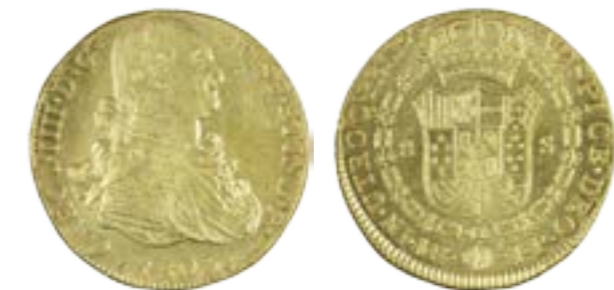
Monedas de 8 escudos de Carlos IV Lima, 1803 Oro Pecio de la fragata Mercedes Museo Nacional de Arqueología Subacuática (ARQUA), Cartagena, Murcia

En 2015, España ha realizado la primera expedición arqueológica al pecio de la Mercedes para evaluar el estado en que se encuentra el yacimiento. Un vídeo proyectado en la exposición da testimonio de esta actuación.