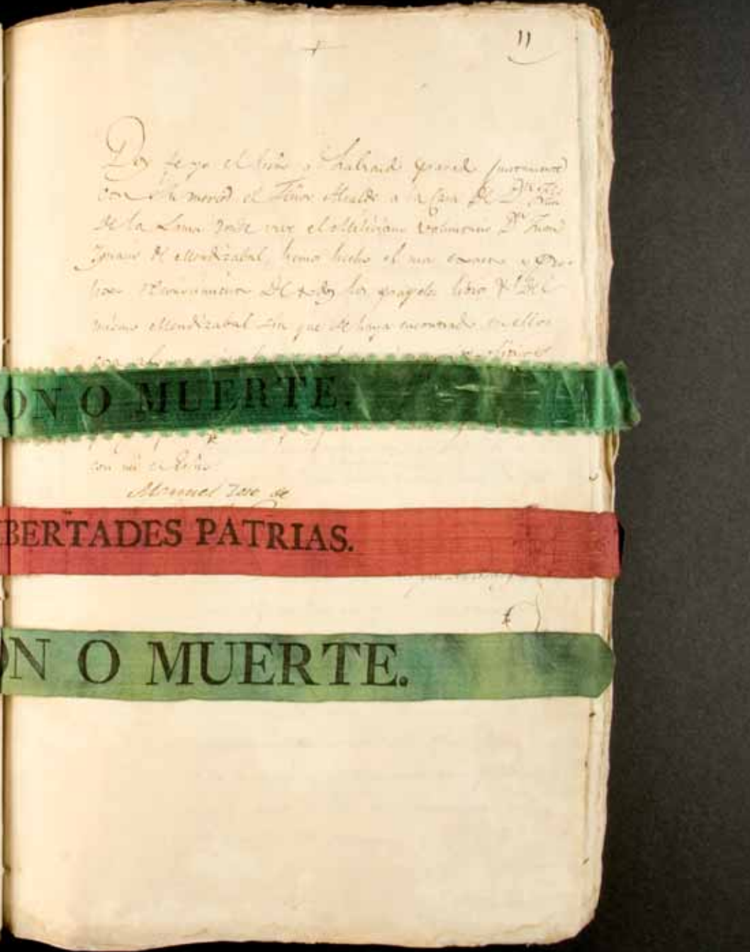
Fig. 7 Pleito criminal contra Juan Ignacio Mendizábal, miliciano vecino de Tolosa (Guipúzcoa), por llevar inscripciones constitucionalistas y subversivas. 1823. ARCHV, Salas de lo criminal, caja 4.3.