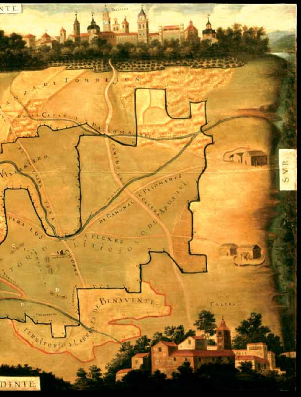
Fig. 9 Carta topográfica del territorio litigioso del Ardhví, delimitado por línea de mojonos, y próximo a Talavera de la Reina (Toledo). Segunda mitad del siglo XVIII. ARCHV, Planos y Dibujos. Óleos, 37.