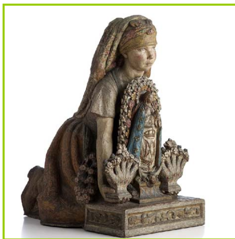
Filiña . Francisco Asorey. 1948