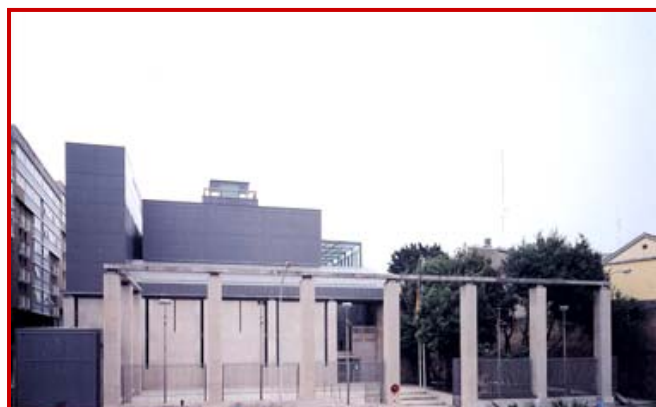
Fachada de Museo de Bellas Artes de A Coruña

El museo presenta ahora una selección de 160 piezas de sus fondos, asociadas a 210 imágenes.