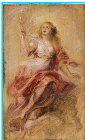
Psique . Peter Paul Rubens. 1636 ca.