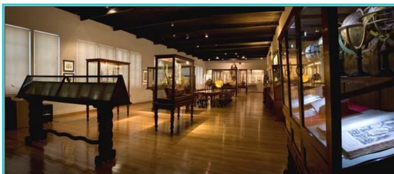
Sala III del Museo.

Acceso al catálogo colectivo de la Red Digital de Colecciones de Museos de España: http://ceres.mcu.es