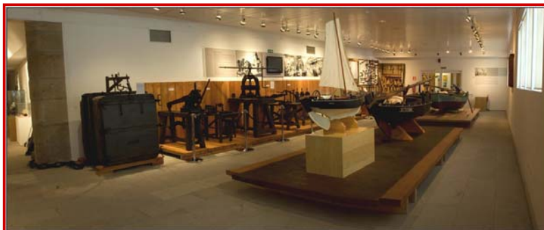
Sala I del Museo.