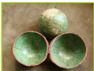
Globo de bolsillo

En esta sección destaca la colección de libros incunables y numerosos ejemplares de los siglos XVI, XVII y XVIII. Entre ellos se encuentran los primeros textos de náutica europeos y libros sobre expediciones marítimas, como el Libro del famoso Marco Polo veneciano (1529), así como documentos y grabados relacionados con la expedición científica de Malaespina. Entre las obras impresas más relevantes podemos citar la Geografía (1490) y el Almagestum (1528) de Claudio Ptolomeo, El Arte de Navegar de Pedro de Medina (1545) y el Regimiento de navegación de García de Céspedes (1606), y entre la serie de manuscritos, diarios de navegación como el de Pedro García Galindo de 1780.