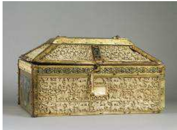
Arqueta de marfil y esmaltes Hecho en los talleres de Cuenca por Muhammad ibn Zayan Año 417 de la Hégira (año 1026 d.C.)