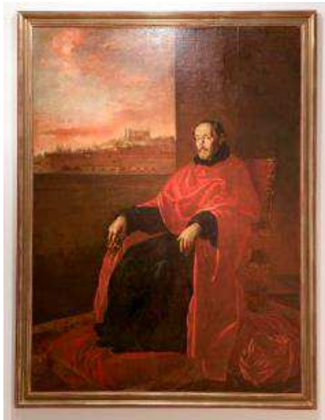
Retrato de Fray Alonso de San Vitores Juan Rizzi, 1659