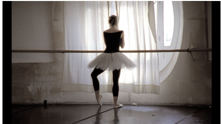
La Danse. La danza. Frederick Wiseman, 2009.