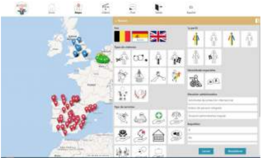
Mapa geolocalizado de recursos