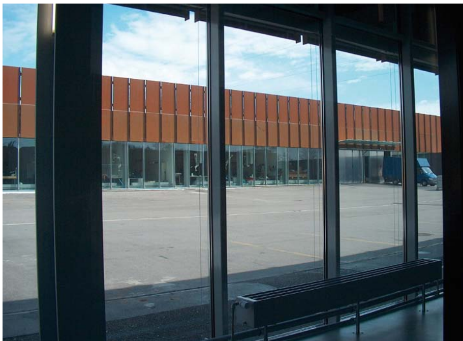
Figura 3. Sammlungszentrum de los Museos Nacionales de Suiza. Vista del edificio de conservación desde el edificio administrativo.

Otra opción a la hora de emplazar y ordenar la conservación y custodia de las