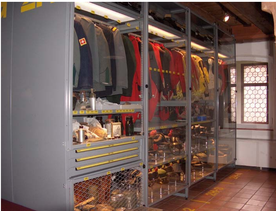
Figura 1. Historisches Museum de Lucerna, Dépôt.