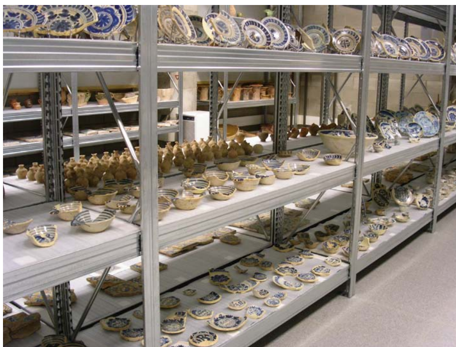
Figura 2. Almacenes externos del Museo de la Ciudad de Barcelona.

Si el museo no puede crecer físicamente en su ubicación tradicional y si las necesidades espaciales crecen, sólo se presentan dos alternativas: o el museo se traslada a una nueva ubicación con más espacio disponible, o el museo debe «deslocalizar» algunas de sus instalaciones, para situarlas en espacios más generosos y modernamente equipados