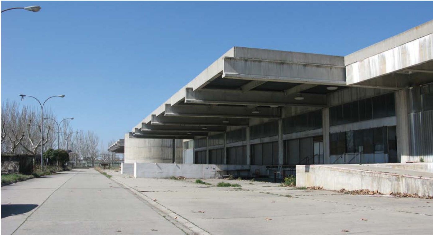
Figura 5. Edificio del futuro Centro de Colecciones de Museos Estatales, de los arquitectos J. A. Corrales y R. Vázquez Molezún (1972).

pública, al ser un centro con proyección social, permeable a distintos tipos de usuarios y visible para la sociedad. La misión del CCME se articula en cinco ejes: