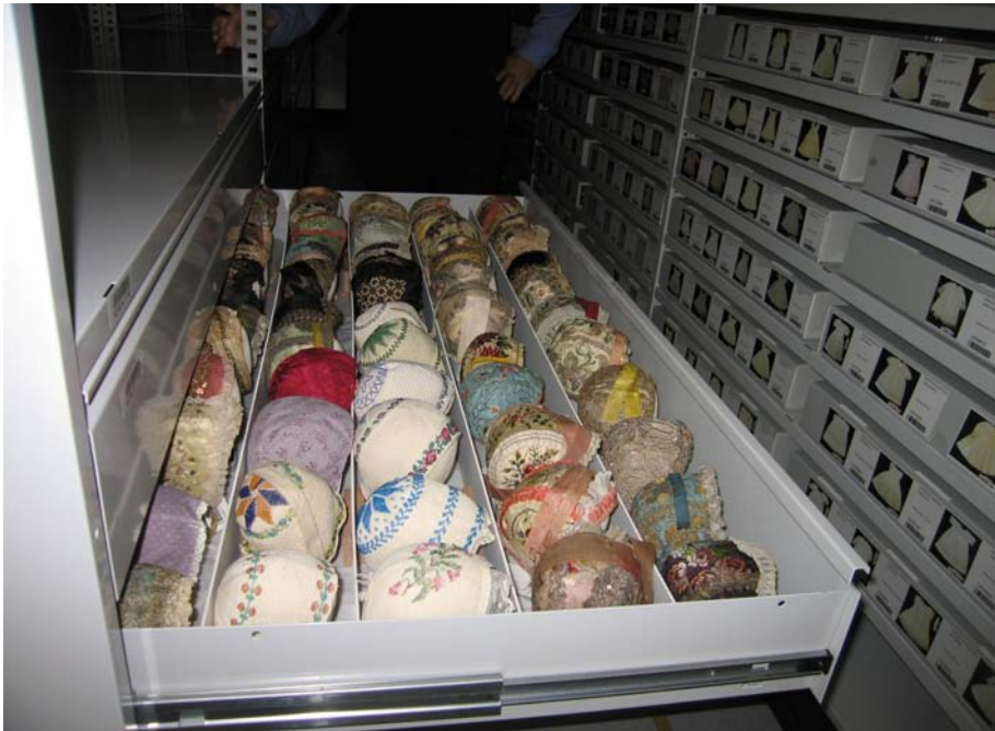
Figura 4. Sammlungszentrum de los Museos Nacionales de Suiza. Instalaciones de almacenamiento.

Los museos del municipio de Marsella ya han prescindido de sus espacios de almacenamiento tradicionales, compartiendo instalaciones y servicios de conservación en la antigua fábrica de tabacos de la ciudad, que alberga además el centro de conservación de la región de Marsella y los archivos municipales de la ciudad. Los almacenes están sectorizados por formatos y necesidades de conservación de las colecciones, si bien cada museo se hace cargo de la gestión de sus colecciones bajo la coordinación de un pequeño equipo que rige el centro.