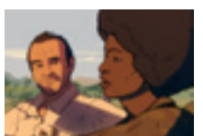
Un día más con vida (2018) (España/Polonia/Alemania/Bélgica)