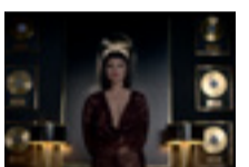
Quién te cantará (2018) (España/Francia)