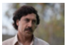
Loving Pablo (2017) (España/Bulgaria)