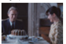
La Librería (2017) (España/Reino Unido)