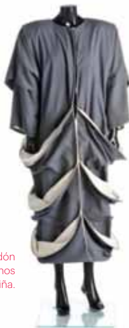
Vestido de tafetán y sarga de algodón con manga murciélago y tres conos invertidos. 1981. Museo Manuel Piña.