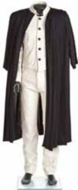
Vestuario personal de Manuel Piña. Abrigo en punto de algodón tableado. Primavera-verano 1983. Traje de napa con pantalón de corte vaquero. 1984. Colección particular