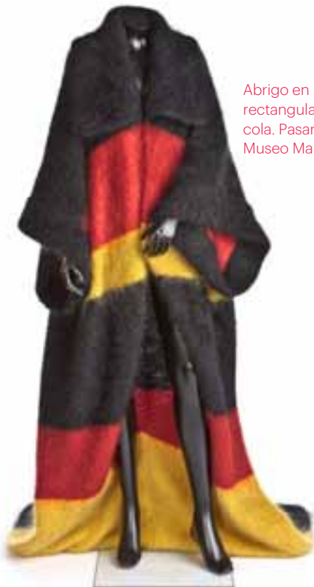
Abrigo en punto mohair, rectangular, con abertura, cuello y cola. Pasarela Cibeles. O-I 1990-91. Museo Manuel Piña