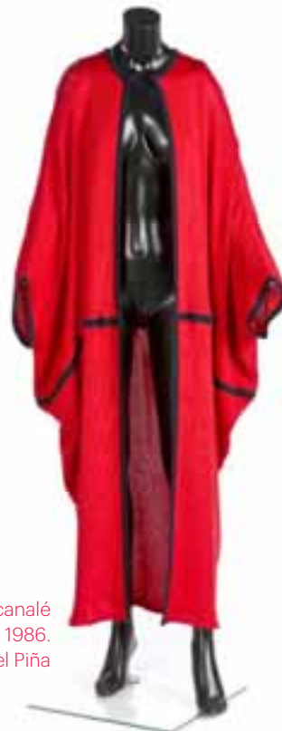
Abrigo cónico en punto de canalé de seda con viveado. P-V 1986. Museo Manuel Piña