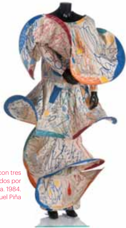
Vestido en tafetán de algodón con tres volantes superpuestos recorridos por aros. Pintado por Juan Gomila. 1984. Museo Manuel Piña