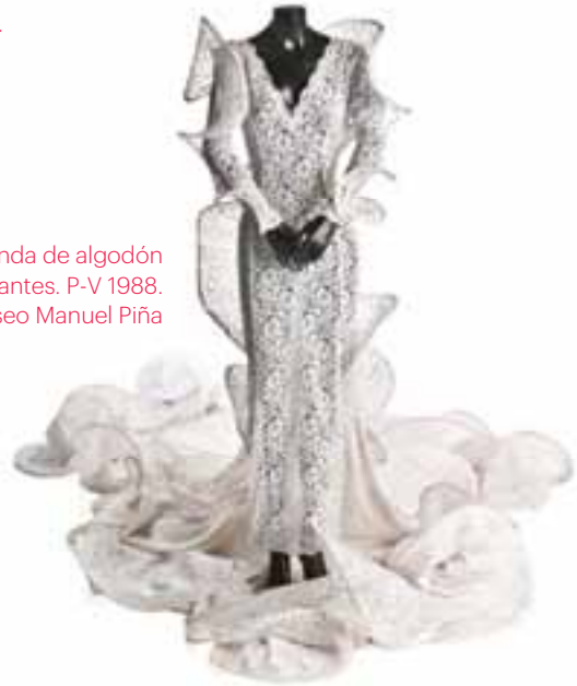
Bata de cola de blonda de algodón con triple cola y volantes. P-V 1988. Museo Manuel Piña