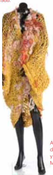
Abrigo artesanal en punto de aguja de lana con aplicación de bellones y mechas. O-I 1989-90. Museo Manuel Piña