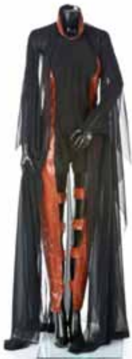
Mono en acanalado de algodón y piel de serpiente, con sisa remetida, cuello halter y capa de gasa. P-V 1990. Museo Manuel Piña