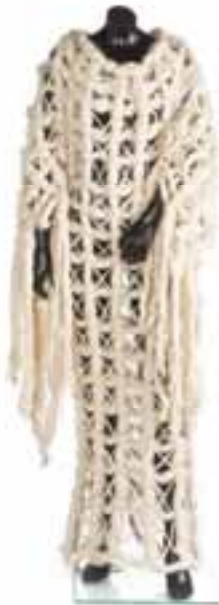
Vestido artesanal en macramé de mechones de lana natural. Otoño- invierno 1990-91. Museo Manuel Piña