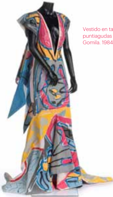
Vestido en tafetán de algodón con puntiagudas alas. Pintado por Juan Gomila. 1984. Museo Manuel Piña