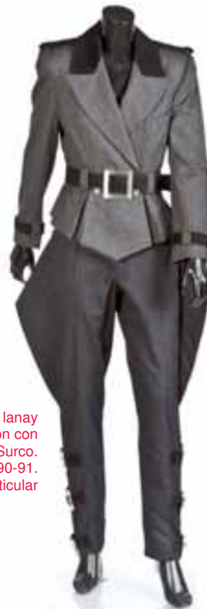
Chaqueta en tafetán de lanay cashmire con ante / Pantalón con aletas y hebillas. Surco. Pasarela Cibeles. O-I 1990-91. Colección particular