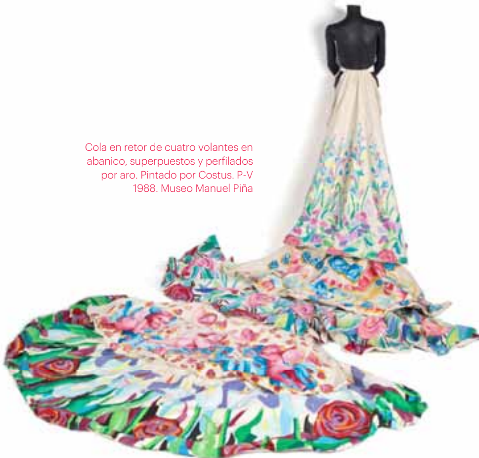
Cola en retor de cuatro volantes en abanico, superpuestos y perfilados por aro. Pintado por Costus. P-V 1988. Museo Manuel Piña