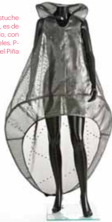
Vestido a modo de estuche inspirado en los insectos, es de tafetán de plástico metalizado, con aro y remaches. Pasarela Cibeles. P-V 1991. Museo Manuel Piña