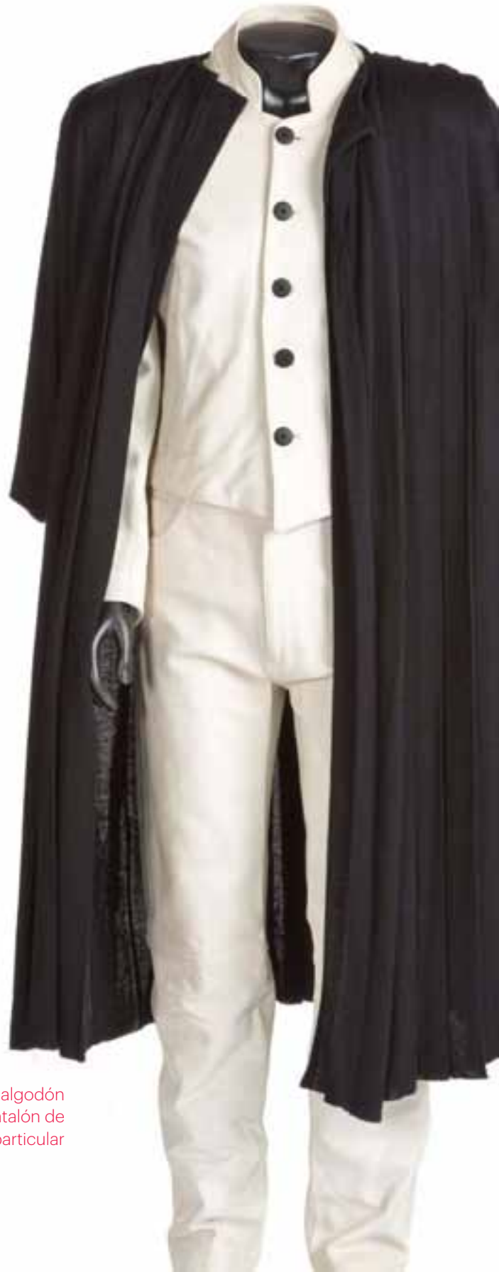
Vestuario personal de Manuel Piña. Abrigo en punto de algodón tableado. Primavera-verano 1983. Traje de napa con pantalón de corte vaquero. 1984. Colección particular

Manuel Piña se inicia en el mundo de la moda a una edad temprana, cuando comienza trabajar en el mundo textil como dependiente de comercios de telas. Tras su llegada a Madrid en 1963, trabaja primero como comercial y más tarde como representante de punto, material considerado como uno de los más comerciales del momento y con el que destacaría especialmente a lo largo de toda su carrera. En 1974 abrió su fábrica de punto en Carabanchel desde la cual revolucionó el vestuario de calle femenino, convirtiéndose así en uno de los diseñadores más notables dentro del mundo empresarial. 1974 también sería la fecha de creación de su propia firma “Manuel Piña, S.A.”. A partir de entonces distribuye sus modelos por todo el país y logra un éxito fulgurante gracias a su clara visión de las necesidades del vestir femenino.