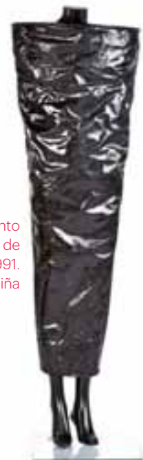
Vestido en punto acharolado, en forma de cono invertido. P-V 1991. Museo Manuel Piña