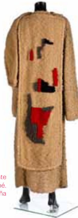
Abrigo talar realizado artesanalmente en tafetán de algodón con macramé. O-I 1982-83. Museo Manuel Piña