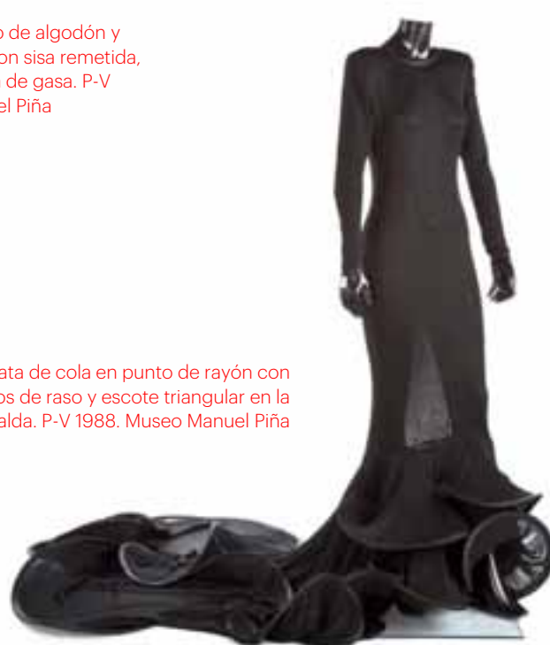
Bata de cola en punto de rayón con vivos de raso y escote triangular en la espalda. P-V 1988. Museo Manuel Piña