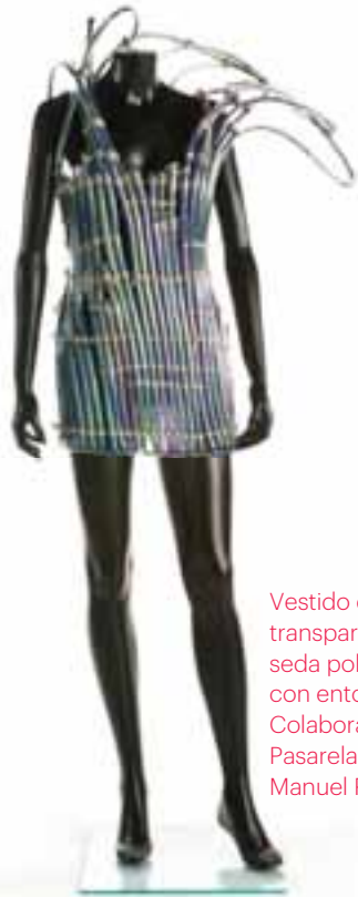
Vestido de tubos de plástico transparente rellenos de hilos de seda policromos y unidos entre sí con entorchado metálico. Colaboración de Enrique Sinovas. Pasarela Cibeles. P-V 1991. Museo Manuel Piña