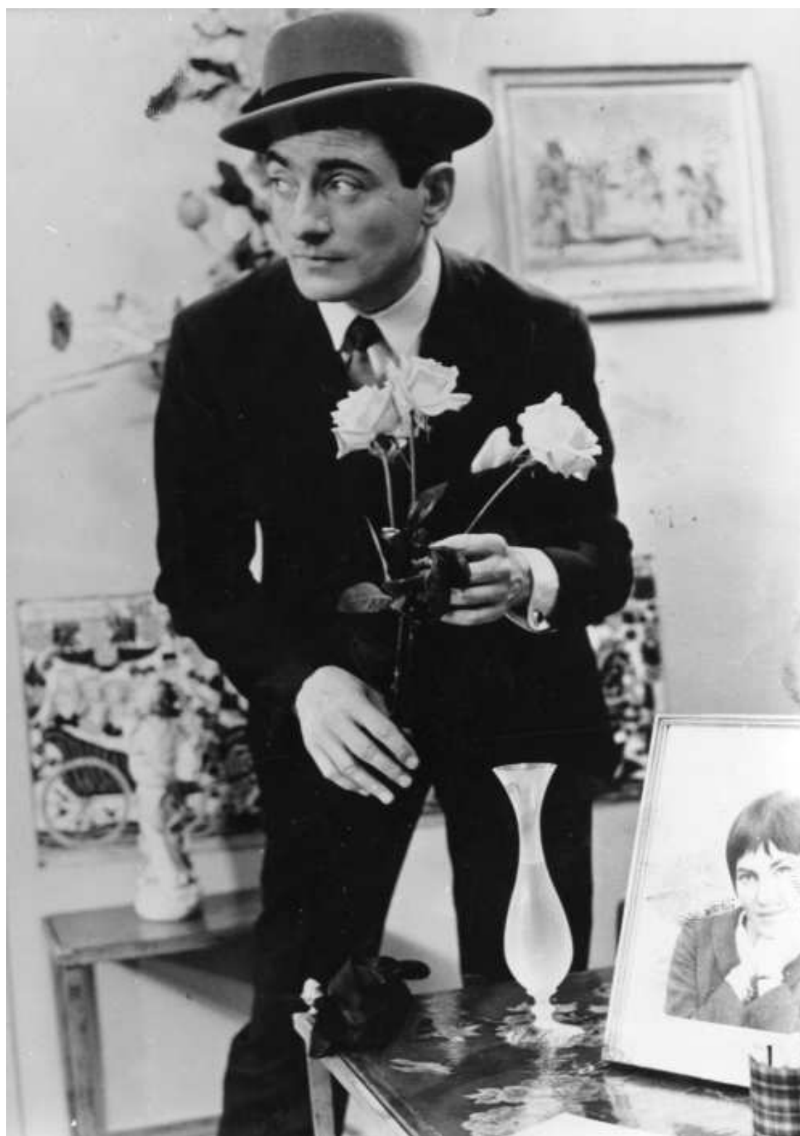
Pierre Etaix en Le Soupissant (El pretendiente) , P. Etaix, 1963)

Suscripción a la alerta del programa mensual del cine Doré en: