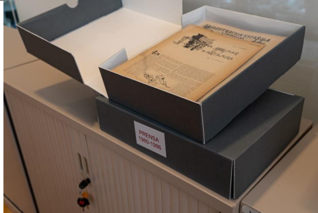
Instalación de la prensa en cajas y fundas