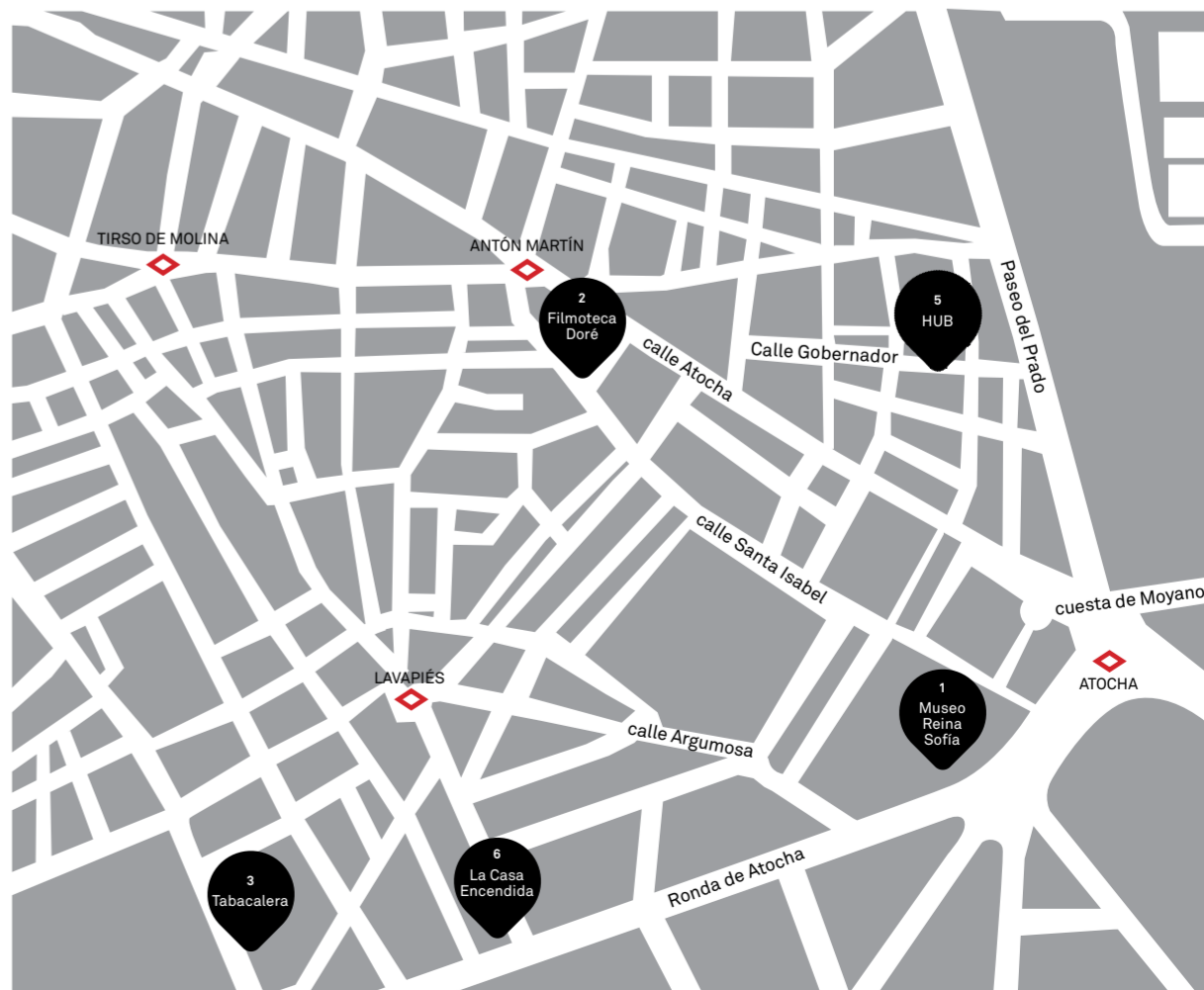
Diseño gráfico: Jaime Naváz.