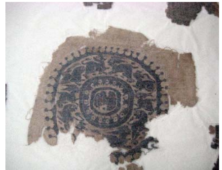
Detalle de un fragmento.