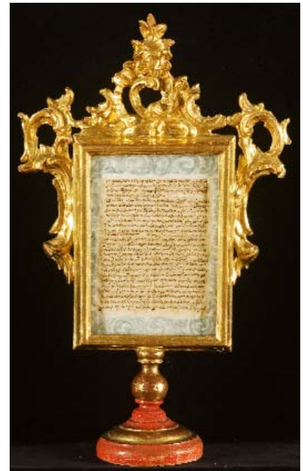
Relicario rococó de madera.