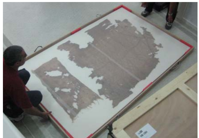
Embalaje y preservación de los tejidos diseñados para su traslado al IPCE.