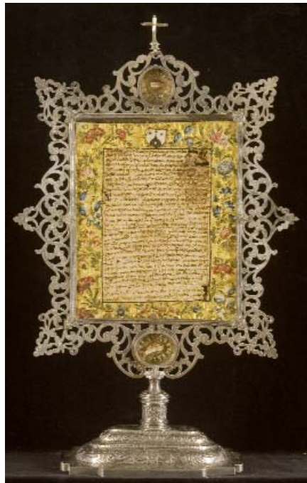
Relicario de plata.

Los cuatro contienen documentos en papel, que según sus propietarios son las copias conservadas más cercanas a la obra original, actualmente perdida, Exclamaciones del alma a Dios de Santa Teresa de Jesús. Las cuatro hojas de papel, manuscritas por ambas caras, presentan orlas decorativas enmarcando el texto, realizadas en pan de oro con motivos vegetales y, a su vez, coronadas por el escudo de la Orden Carmelita.