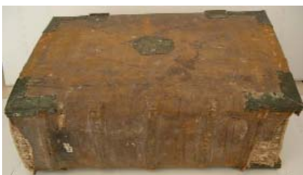
Misal cisterciense, S. XV - Biblioteca Pública de Cáceres.

Este Misal Cisterciense es un libro de gran formato en pergamino del siglo XV, integrado por dos volúmenes manuscritos en letra gótica fracturada de tipo litúrgico, con iniciales en tintas roja y azul.