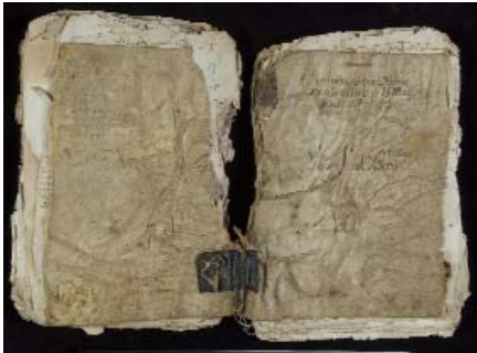
Libro 1 de Bautismos. Cubierta de pergamino.