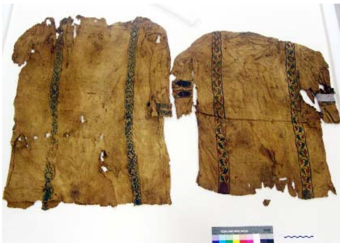
Detalle de prendas de indumentaria.