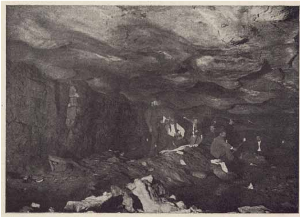
Fig. 1. Visitantes de la cueva de Altamira, alumbrándose con antorchas (Cartailhac, y Breuil, 1906).