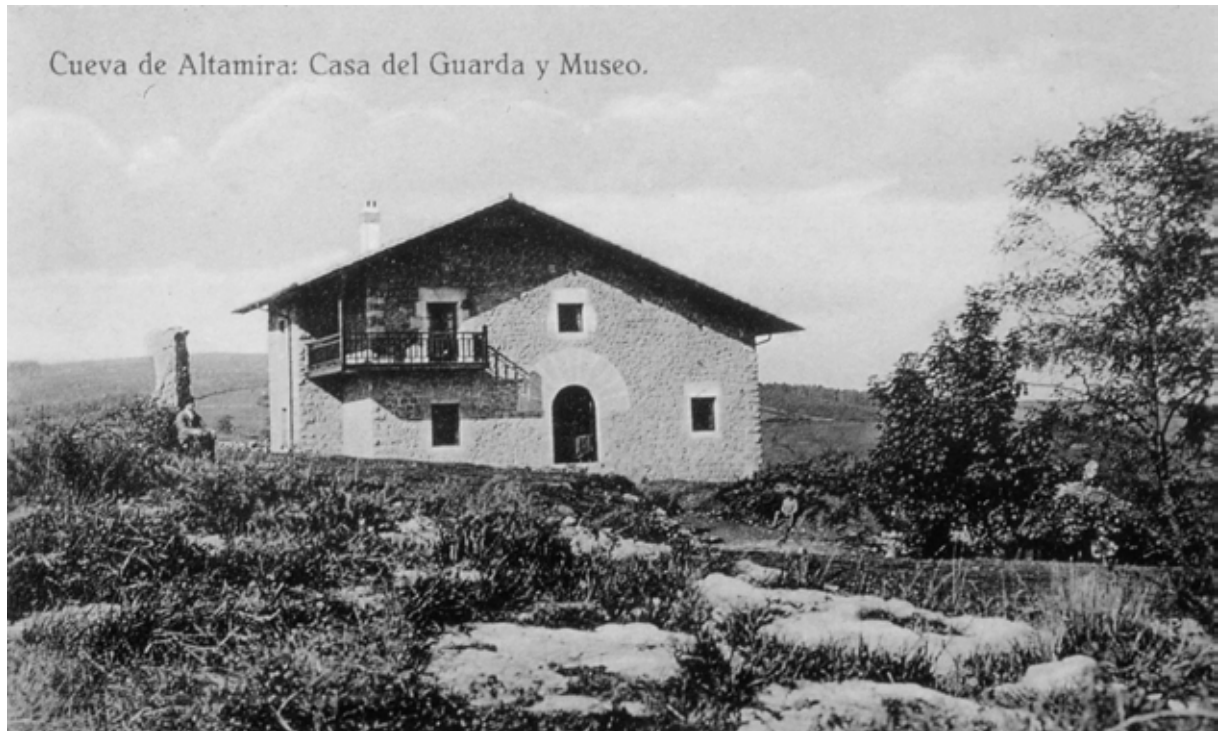
Fig. 3. Imagen de la casa construida para Museo y vivienda del guardia (postal turística, autor desconocido).