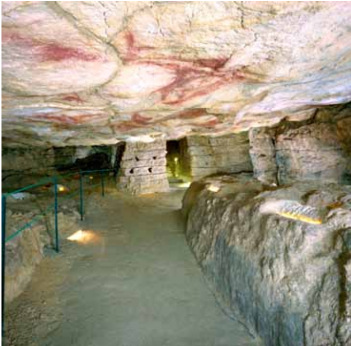
Fig. 4. Sala de polícromos de la cueva de Altamira, puede apreciarse el perfecto acondicionamiento para la visita pública. (Fotografía tomada hacia 1975).