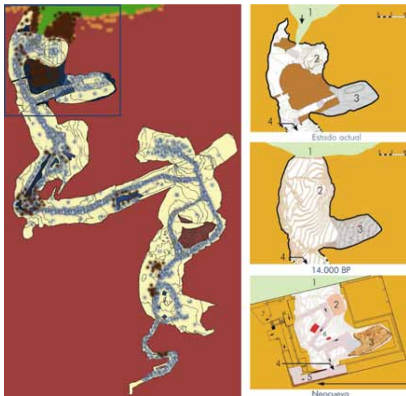
Fig. 8. Plano de la cueva de Altamira, con las transformaciones sufridas en su interior, tanto de forma natural como por su adecuación para las visitas públicas. La Neocueva recoge la imagen de la cueva de Altamira tal y como era hace 14 000 años. (Diseño: Museo de Altamira).

Fig. 7. Imagen en la que se observan los tres Museos de Altamira. En primer plano se encuentra el nuevo edificio para Museo (2001), perfectamente integrado en el paisaje. Al fondo, los tejados plateados de los pabellones (1973) tras su rehabilitación arquitectónica (2005). En el centro, arriba, la «casa de 1924».