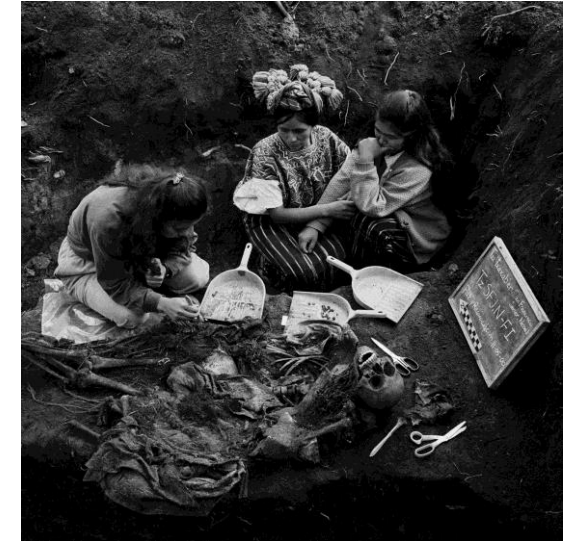
Jonathan Moller, Cercanías de la aldea de San Francisco Javier (Nebaj) 2000

En este curso proponemos abordar los estudios de memoria con una especial atención a la perspectiva de la antropología social, aunque entre los participantes habrá también historiadores, juristas o especialistas en crítica literaria. Tras un panorama general de la teoría de los estudios de memoria, profundizaremos en distintas áreas temáticas que combinan memoria y antropología como pueden ser el paisaje, la política, el cuerpo, la imagen, el arte, las instituciones o la justicia. Aunque el objetivo del curso es muy amplio y pretende explorar creativamente las conexiones entre la disciplina antropológica y los estudios de memoria, habrá un énfasis en España y en el análisis de los debates sobre la memoria del pasado represivo de la Guerra Civil y la dictadura franquista. Así, aunque se debatirá el caso de los procesos de memoria vinculados a las exhumaciones de fosas comunes de guerra y otros ámbitos memoriales asociados, también estarán presentes otras áreas geográficas como Colombia o Perú, donde las políticas de la memoria de los conflictos internos también revisten una gran complejidad. De esta manera, en este curso tendremos la oportunidad de reflexionar críticamente sobre las modalidades y políticas de reelaboración del pasado y su influencia en el anclaje de los “presentes” que vivimos y los “futuros” que anticipamos.