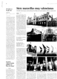
“Siete maravillas muy valencianas”, publicado en El País , 6 de octubre de 2008

seo Nacional de Cerámica. Durante el pasado 2008, el Museo fue objeto de noticia en un total de 137 ocasiones. Entre todas estas noticias, destacan las referidas a exposiciones temporales (40'7%) y aquellas que tienen como objeto el Museo y su sede, el Palacio del Marqués de Dos Aguas (27'01%). En este último caso, tema de especial interés para la prensa valenciana durante 2008 ha sido la futura ampliación del museo y la elección del Palacio como una de las siete maravillas valencianas en la categoría de “Pieza Arqueológica y Obra de Arte”.