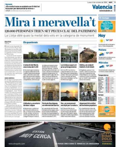
“Mira e meravella't”, artículo publicado en el diario ADN , el lunes 6 de octubre de 2008