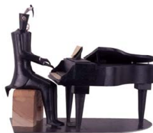
Escultura porcelana de Pilar Carpio, "Homenaje a Francisco Cuesta i Gómez, Tío Abuelo, compositor de música" (2006). Museo Nacional de Cerámica

cípulo de José Iturbi y Leopoldo Querol, y compuso sobre todo obras para piano.