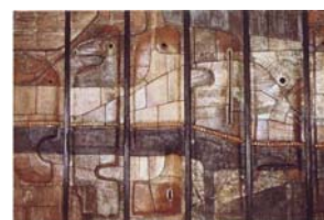
Serie Muros para defenderse del miedo (1975–1986)

Cerámica realizada en plena transición hacia la democracia, en la que expresa los miedos que la sociedad tiene a los cambios que se estaban experimentando y que provocan que ésta levante muros que le protejan de este aire fresco. También estos muros expresan los propios miedos del artista, ante la sociedad que se estaba configurando, alejada de los ideales sociales que él tanto había propugnado.