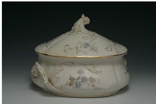
SOPERA DE LA FABRICA DE VALDEMORILLO

En cuanto a la producción de loza, sabemos que fue escasa, pero de gran calidad, lo que ha provocado que las piezas de esta manufactura sean difíciles de encontrar en el mercado. Esto dota de una mayor importancia a la colección adquirida, la cual está compuesta por 85 piezas, entre las que destacan las piezas decoradas con escenas de inspiración inglesa, o las 57 piezas de una vajilla modernista.