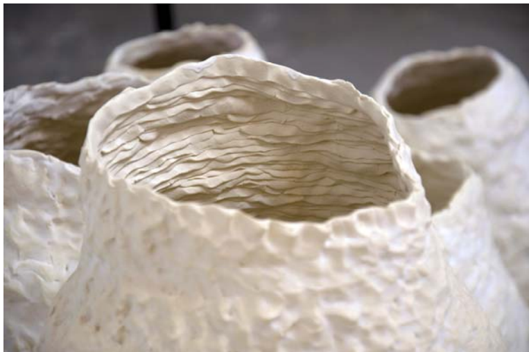
JARDÍN MADRE. DETALLE. OBRA DE BIBIANA MARTÍNEZ

En esta propuesta se integran varias dicotomías: lo individual y lo colectivo, tradición y modernidad, lo endógeno y lo exógeno. Síntesis es el término que resume el carácter de una exposición donde la suma, lejos de homogeneizar, da como resultado una pléyade de posibilidades cerámicas.