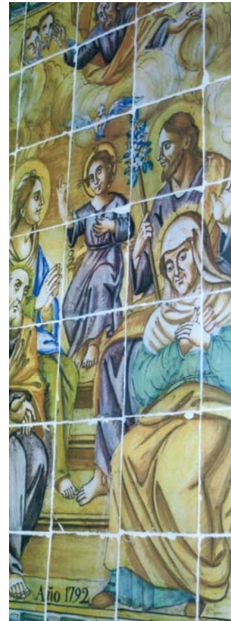
DETALLE DEL PANEL CE1/15437