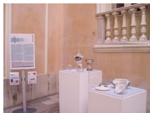
EXPOSICIÓN DE LAS PIEZAS

La Real Fábrica de Porcelana fue fundada por Carlos III en 1759 e instalada en el parque madrileño del Buen Retiro. Como el resto de manufacturas reales creadas por las monarquías ilustradas del siglo XVIII, la fábrica se creó con el objetivo de reducir las importaciones y dotar a los palacios reales de objetos decorativos de lujo. Fabricó piezas de vajilla, objetos decorativos y pequeñas esculturas de temas diversos. La manufactura se vio obligada a parar la producción y cerrar en 1808 debido a la presencia de las tropas napoleónicas.