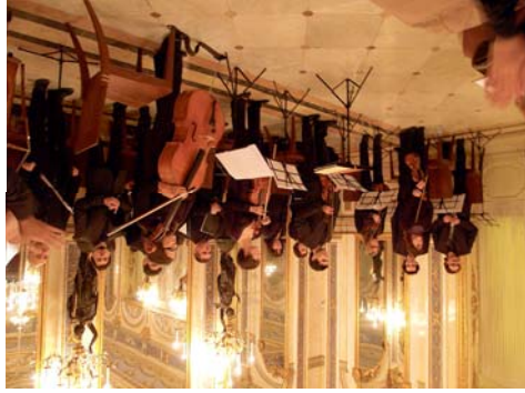
La Asociación Orquesta de Cámara y Coro del Palacio de Dos Aguas