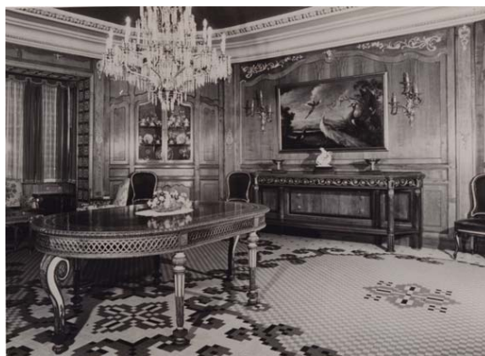
Vista del salón comedor de la vivienda de la calle de la Paz donde se encontraba originalmente el pavimento.

promovido por Francisco Casanova Llopis (1881-1951) y su hermano Manuel, en 1926, bajo la dirección del arquitecto Vicente Rodríguez (1875-1933), destinado únicamente para viviendas de la familia. En el año 2001 sus herederos, con la mediación de los Amigos del Museo, acceden al rescate del mosaico y su ingreso en la rica colección Museo Nacional de Cerámica y Artes Suntuarias “González Martí”.