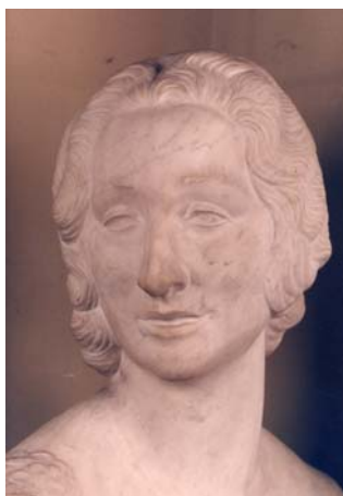
Busto de Lucrecia Bori, obra de Ignacio Pinazo Martínez (Sala gótica o de los Pinazo, primera planta)

les del Ministerio de Cultura, la entrada al museo fue gratuita para todas las mujeres del martes 9 al domingo 14 de marzo. A esta iniciativa también se sumaron los demás museos estatales gestionados por el Ministerio de Cultura.