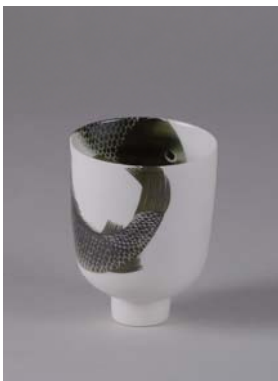
Colección Egner. Anima Roos

coleccionista que sin ningún fin mercantilista y de manera totalmente altruista donan sus colecciones a aquellos museos con carencias, con el fin de que toda la sociedad pueda disfrutar de la cerámica.