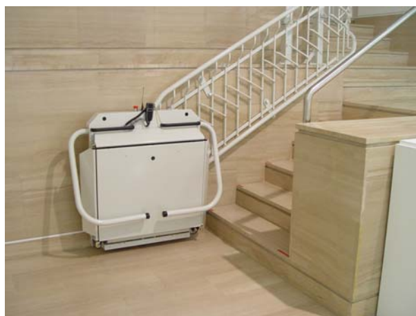
Plataforma salvaescalera en las salas de exposiciones temporales I.

permiten a los visitantes en sillas de ruedas acceder a esas zonas y disfrutar de las exposiciones temporales y las actividades del museo en su totalidad.