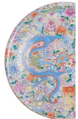
Colección Knecht – Drenth. Plato "mil flores".