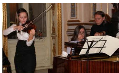
Concierto de Marzo