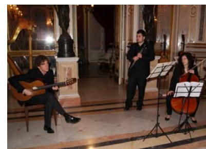
Concierto de Febrero