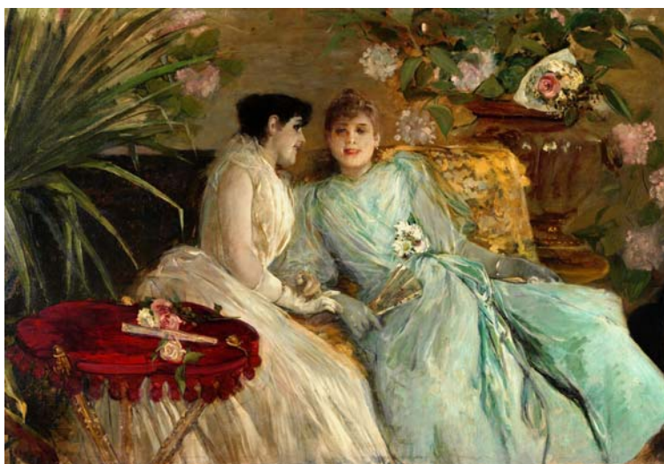
Retrato de las hijas y sobrino del señor Pampló (1889), Ignacio Pinazo