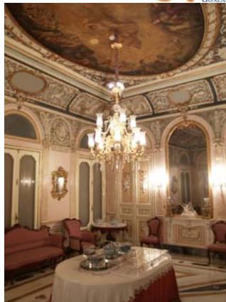
Vista del comedor del Palacio, Primera planta

el día 22, se centró esta vez en un tipo de fondos que conserva el museo, los países de abanicos, presentándose la conferencia "El Art Nouveau y Art Déco en los países de abanicos del museo". Con esta actividad se pretende dar a conocer más en detalle la historia de la sede del museo, el Palacio de Dos Aguas, y de los fondos conservados en el museo. [LCD]