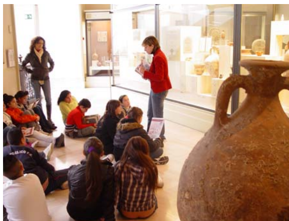
Para más información, consultar la Web del Museo.