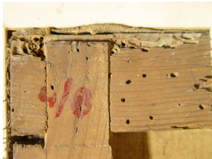
Deterioro producido por insectos xilófagos en un bastidor

Además de eliminar la contaminación debe actuarse sobre las causas que la generaron para evitar que reaparezca. La única estrategia eficaz para prevenir este riesgo es crear un hábitat que dificulte el desarrollo de los agentes biológicos, atendiendo especialmente a las condiciones ambientales. [IFB]