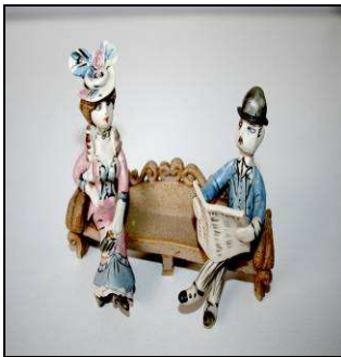
Hilary Brock Reino Unido