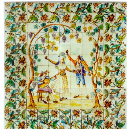
Panel de danzantes. Patio del primer piso del museo.

Cabe destacar además, que en el año 2000, el panel fue objeto de una restauración ya que presentaba lagunas, fracturas y faltas de cohesión en gran parte de los azulejos.