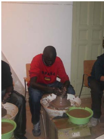
Uno de los participantes al taller de cerámica, fabricando un recipiente con el torno de alfarero.

Durante el mes de noviembre, el museo ofreció de nuevo el taller de iniciación a la cerámica, y concretamente al manejo del torno de alfarero, actividad gratuita abierta a todo tipo de colectivos que lo solicitaran con antelación. El museo acogió con esta actividad a grupos escolares y colectivos de adultos, como alumnos de la Universidad Popular, asociaciones o una ONG de ayuda al inmigrante. Las sesiones se desarrollaron de lunes a viernes en horario de mañana y tarde para una mayor flexibilidad y adaptación a las necesidades particulares de cada colectivo.