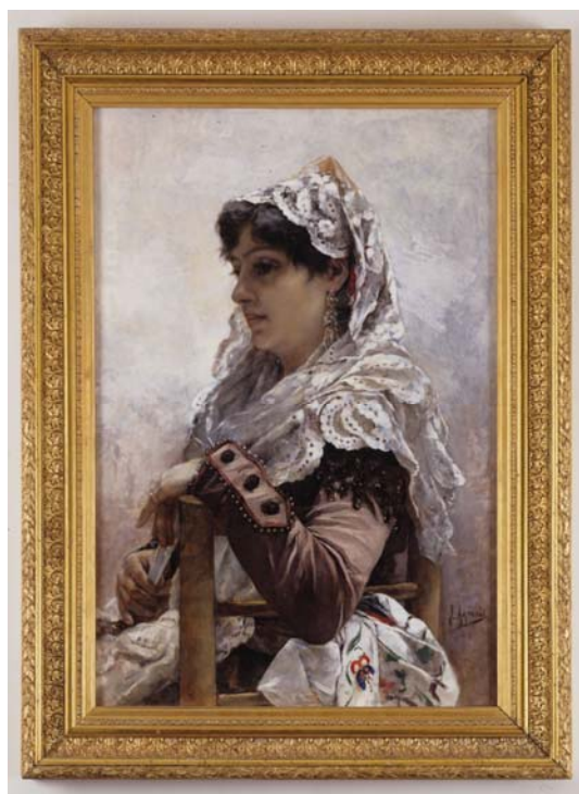
Joaquín Agrasot, Valenciana . Obra expuesta en la Sala Pinazo de la primera planta del museo.

Aunque entre los fondos de la colección encontramos interesantes testimonios de pintura antigua, el grupo de mayor calidad y mejor representado es el que se corresponde con la generación de pintores que fue coetánea a don Manuel González Martí, en el que despuntaron artistas como Ignacio Pinazo, Emilio Sala, Bartolomé Mongrell, José Renau, Pascual Capuz o Ricardo Verde. A algunos de estos pintores, González Martí les dedicó salas especiales dentro del Museo Nacional de Cerámica ya que, en sus orígenes, esta institución también tenía la intención de ser una especie de museo de la memoria, incluyendo a personajes ilustres y otros pequeños detalles de la vida valenciana.