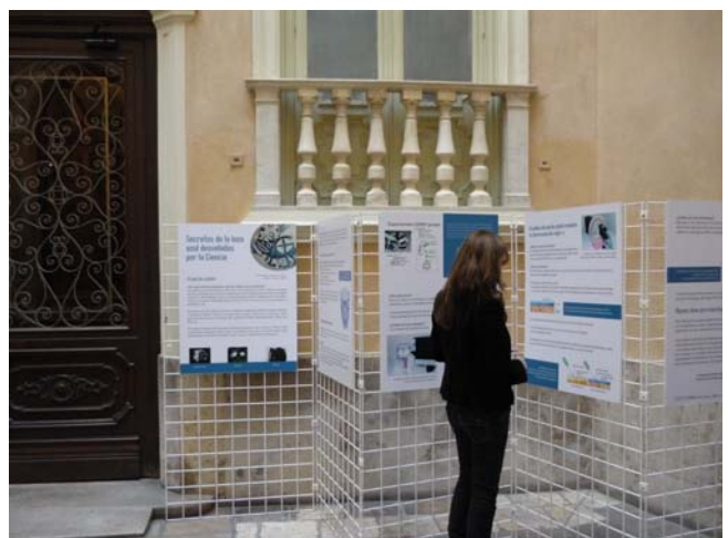
Una visitante del museo delante de los paneles informativos instalados en el patio de entrada del museo, durante la actividad de la Semana de la Ciencia, el pasado mes de noviembre.

La actividad desarrollada en nuestro Museo muestra los resultados de la investigación de los componentes del pigmento azul de cobalto, empleado en la cerámica valenciana desde el siglo XIV al XX, mediante la técnica de análisis de fluorescencia de rayos - x dispersiva de energía (o EDXRF). Mediante sencillos textos y gráficos, se informaba de manera didáctica de los aspectos básicos de funcionamiento del Espectrómetro EDXRF portátil, así como los resultados concretos de su aplicación al estudio de las lozas con este tipo de decoración.